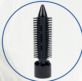
1 Rundbürste (25 mm Ø)